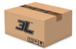
120 pares caja 120 pairs box