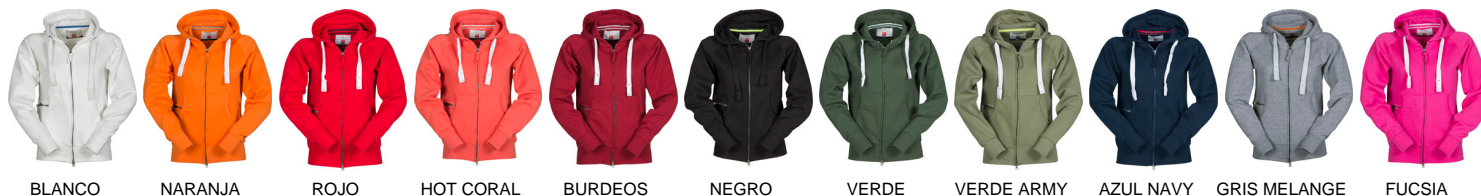
BLANCO NARANJA ROJO HOT CORAL BURDEOS NEGRO VERDE VERDE ARMY AZUL NAVY GRIS MELANGE FUCSIA